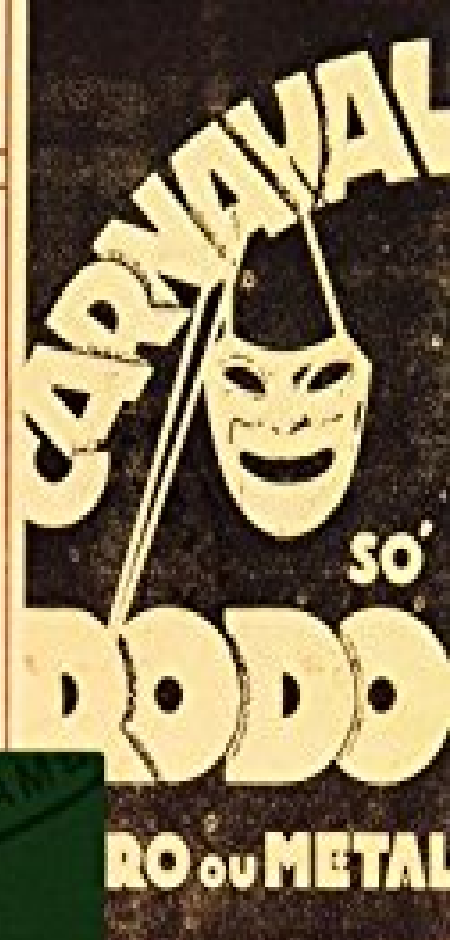
ILUSTRAÇÃO E ARTES GRÁFICAS

Periódicos da Biblioteca Pública do Estado de Pernambuco [1875-1939]